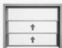
Avec deux sections coulissantes