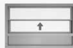
Sections en aluminium fixées sous la fenêtre