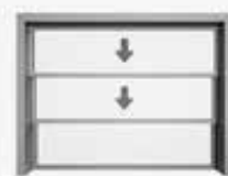
Avec deux sections coulissantes s'ouvrant vers le bas