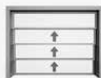
Avec trois sections coulissantes