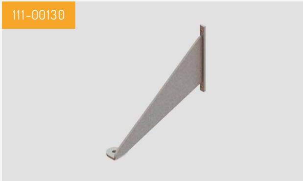
Pied Standard Livré par lot de quatre