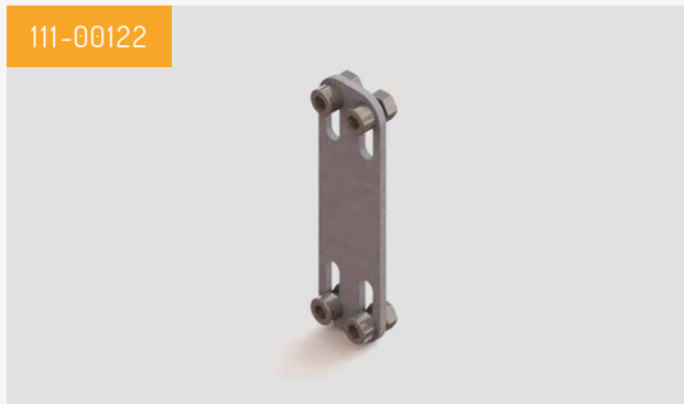
Plaque de fixation pour assemblage des éléments entre eux ou montage sur un poteau/mur. Livré par lot de deux.