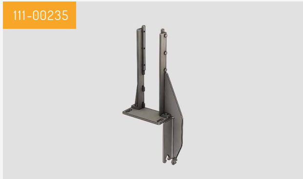
Pied de balcon surélevé Livré par lot de deux