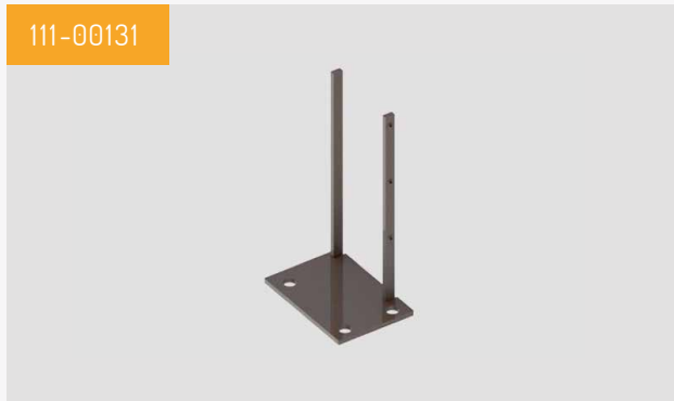
Pied à visser Livré par lot de deux