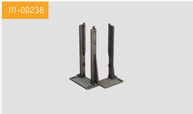
Pied à clipser d'angle 1 pièce