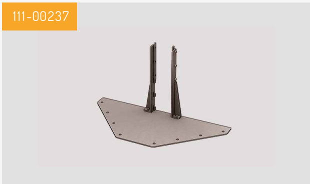
Big Foot Livré par lot de deux