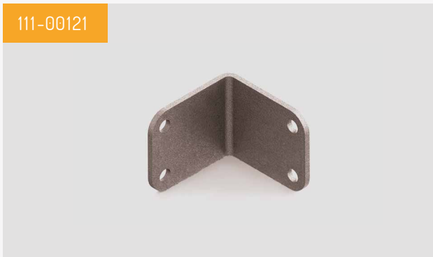
Plaque de fixation d'angle à angle droit Livré par lot de deux.