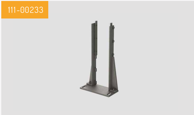
Pied à clipser Livré par lot de deux